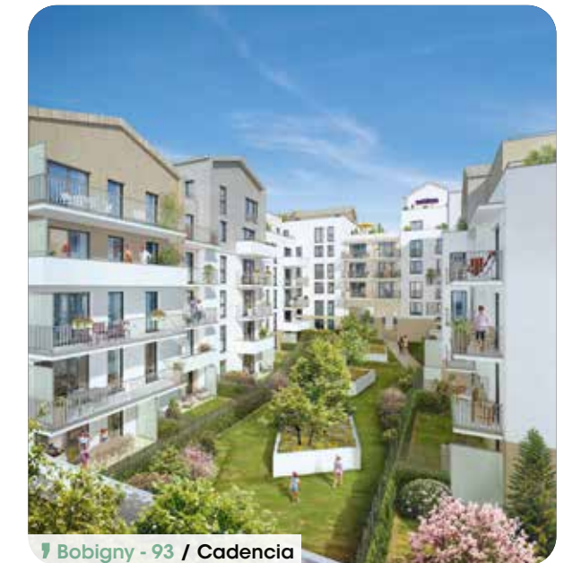
Bobigny - 93 / Cadencia

Avec l'immobilier neuf, vous avez plus d'un avantage et longtemps. La preuve, votre bien immobilier neuf n'a que des atouts :