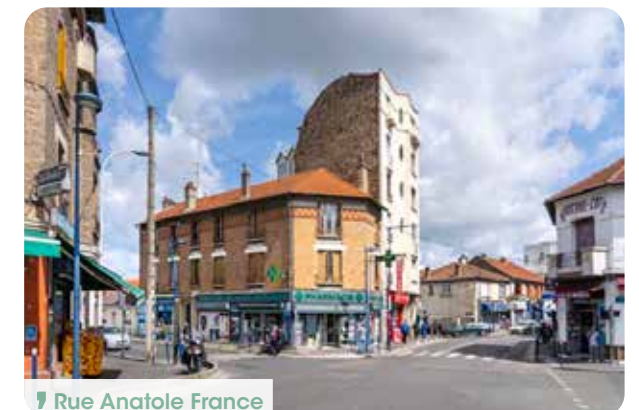
📍 Rue Anatole France