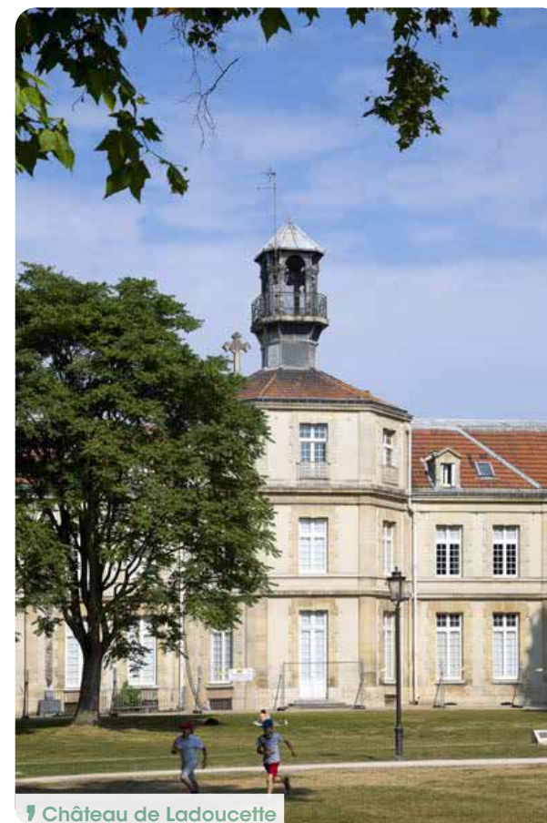
📍 Château de Ladoucette

Avec son équilibre parfait entre praticité, verdure et tranquillité, cette adresse offre un cadre de vie idéal pour tous les âges et tous les styles de vie.