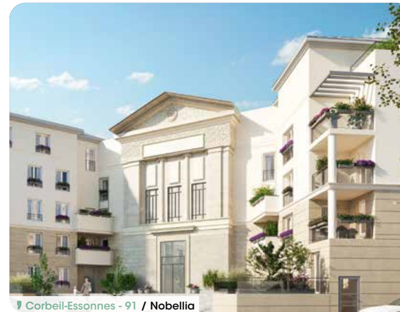
Corbeil-Essonnes - 91 / Nobellia