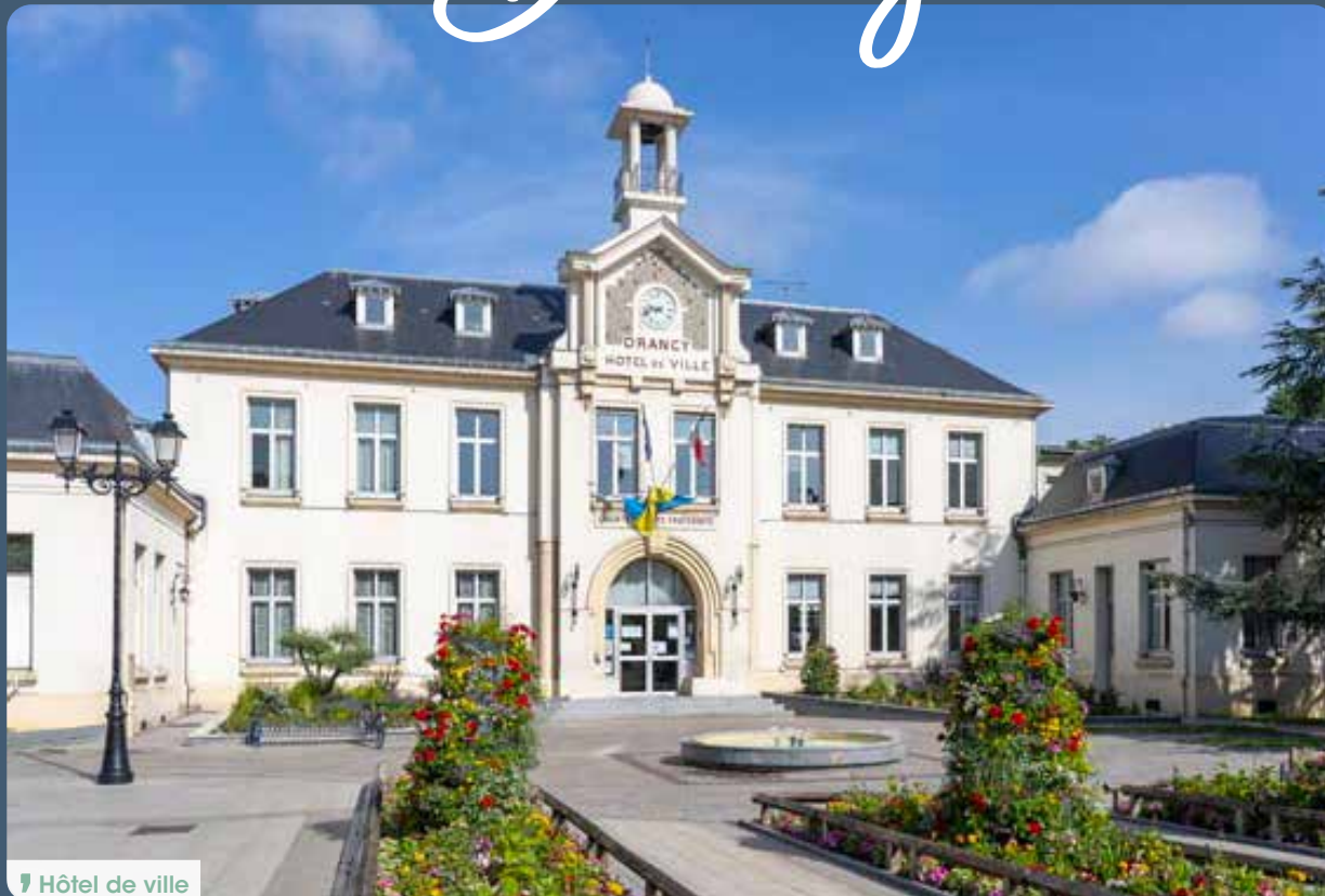
📍 Hôtel de ville