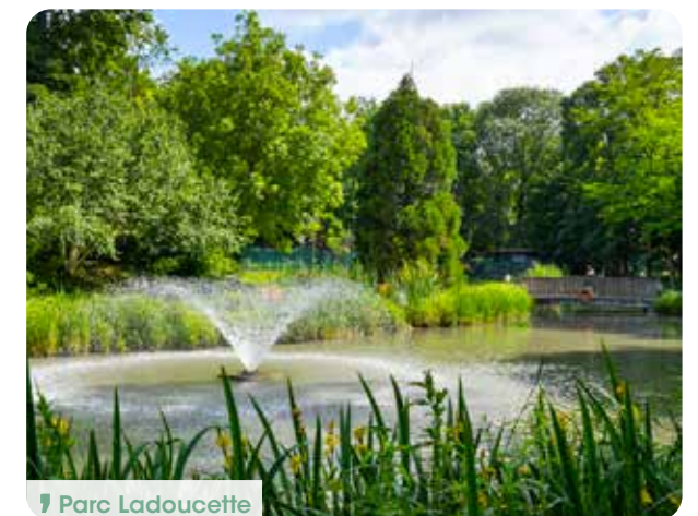
📍 Parc Ladoucette