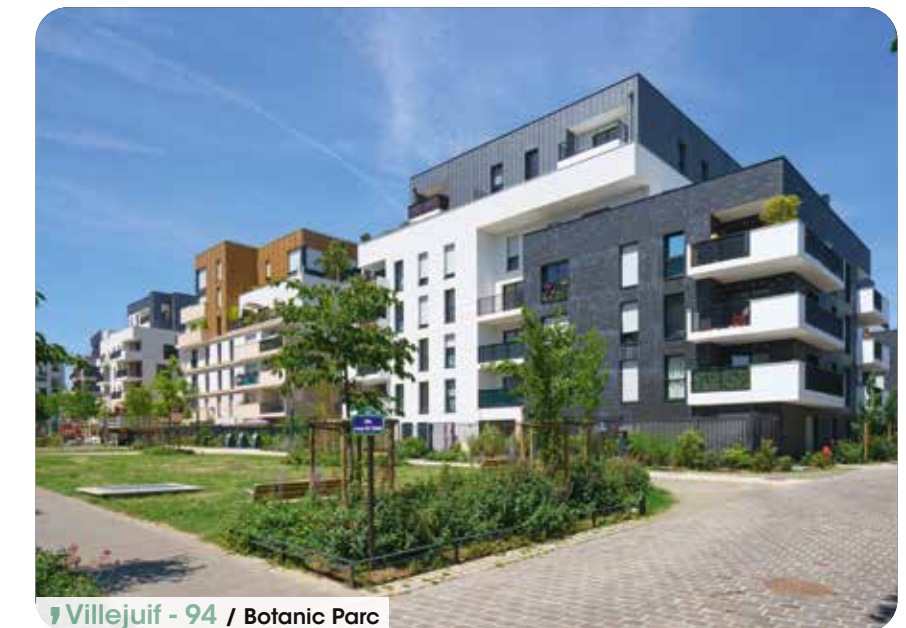
Villejuif - 94 / Botanic Parc