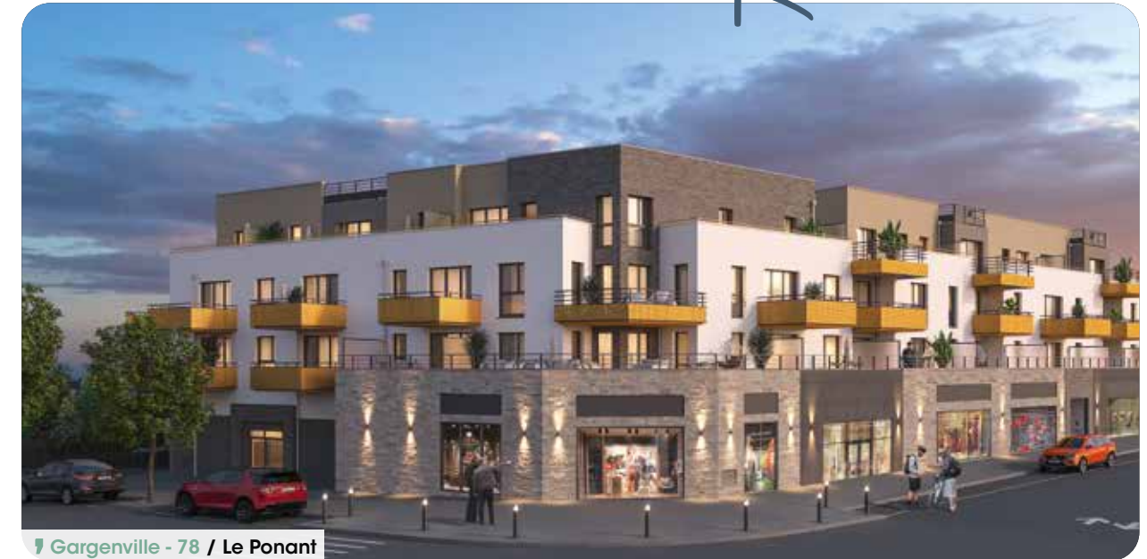
Gargenville - 78 / Le Ponant