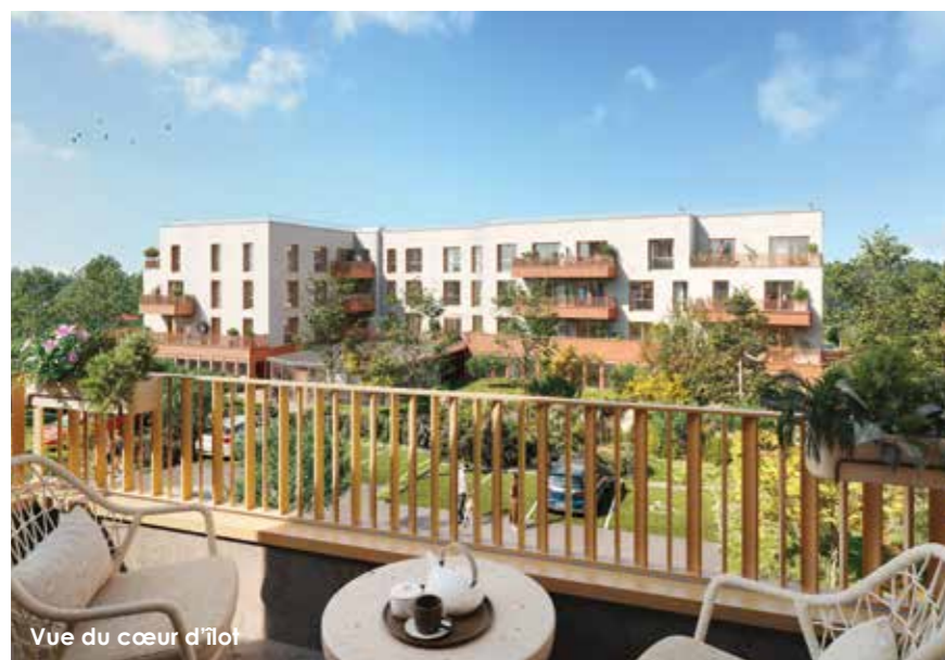
Vue du cœur d'îlot