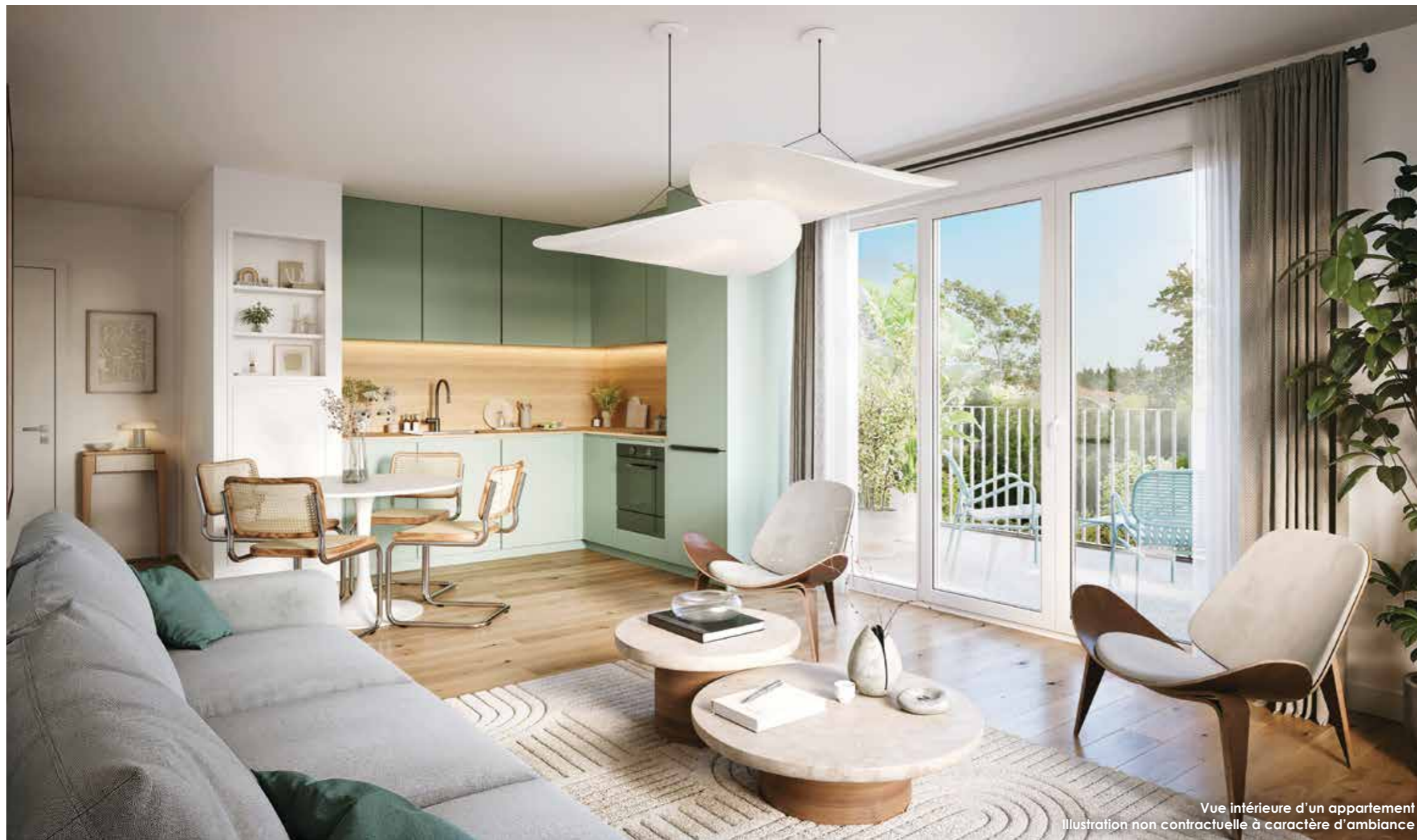
Vue intérieure d'un appartement Illustration non contractuelle à caractère d'ambiance