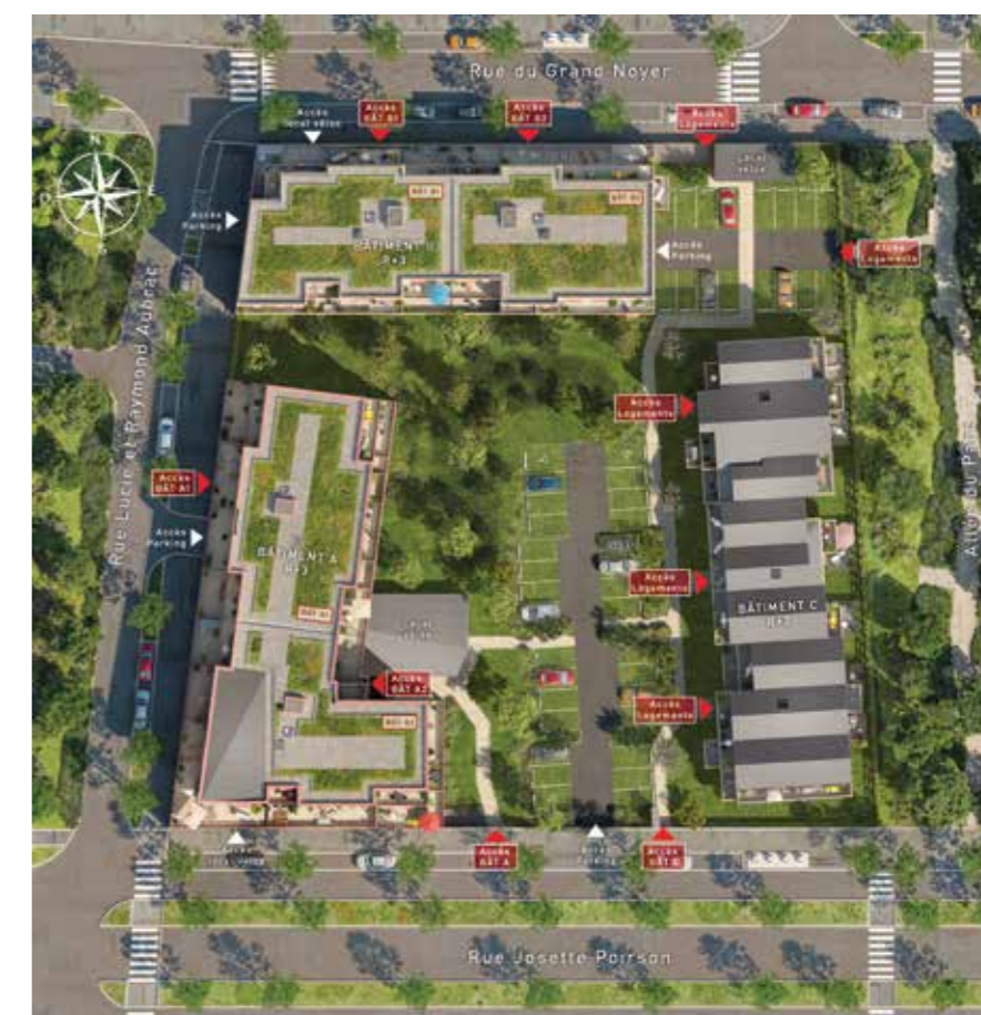
Vue du ciel de la résidence

Sécurisée, la résidence propose également des places de stationnement et un local vélo, pour répondre aux usages de chacun au quotidien.