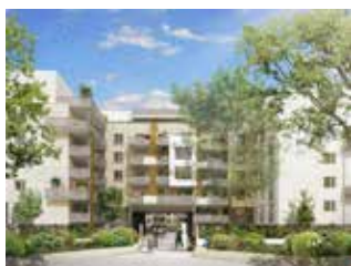
BEAUQUARTIER ARAGON VILLEJUIF

Elle concerne les dommages qui portent atteinte à la solidité du logement (gros œuvre, étanchéité, etc.) et qui sont susceptibles de rendre le logement impropre à sa destination.