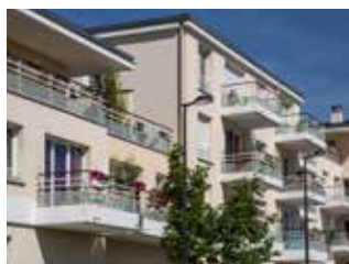
LES TERRASSES DE LA PROUE CORBEIL-ESSONNES