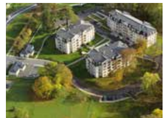
LE DOMAINE DU PRIEURÉ ETIOLLES