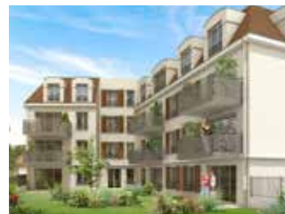
LES CÔTEAUX DU RAINCY LE RAINCY