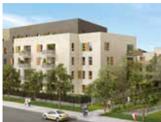
RÉSIDENCE CONTI JOUY-LE-MOUTIER