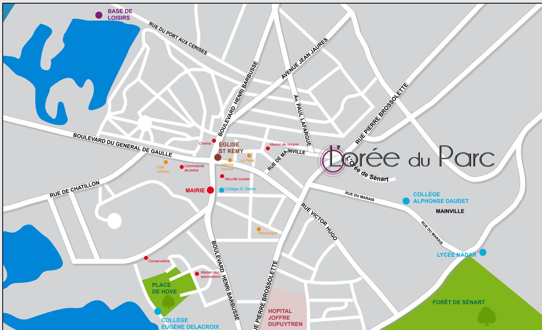
Plan de situation de l'Orée du Parc à Draveil

A l'écart des voies ferrées, la ville de Draveil reste tout de même très accessible. Ses axes routiers sont empruntés par un maillage d'autobus. Les gares les plus proches étant celle de Vigneux-sur-Seine connectée à la Ligne D du RER et celle de Juvisy-sur-Orge qui ajoute une connexion à la ligne C du RER et au réseau TGV. La commune est située à 6km au sud-est de l'aéroport Paris-Orly et 37 kilomètres au sud-ouest de l'aéroport Paris-Charles-de-Gaulle.