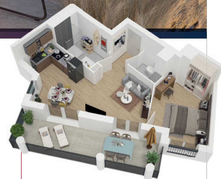
EXEMPLE DE 2 PIÈCES Surface à partir de 37,65m 2