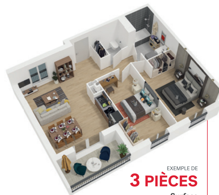
EXEMPLE DE 3 PIÈCES Surface à partir de 55,10m 2

La majorité des logements est doté d'un balcon, ou d'une terrasse. Les volumes généreux et les aménagements intérieurs fonctionnels sont en adéquation avec les modes de vie d'aujourd'hui. La tranquillité en prime.